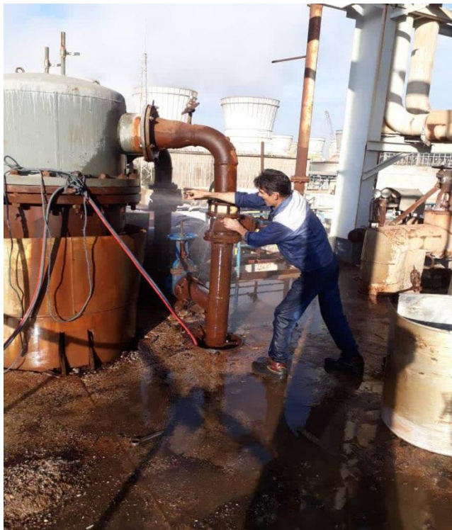
تعمیر والو مسیر خروجی هیتر شیمیایی