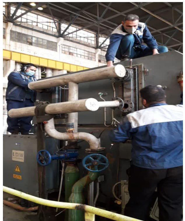
باز کردن کولر هوایی واحد ۶