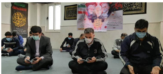
برگزاری مراسم زیارت عاشورا و گرامیداشت سالگرد شهادت شهید حاج قاسم سلیمانی در نیروگاه افق ماهشهر