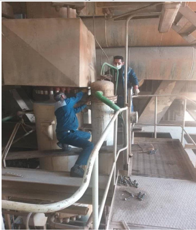
باز کردن و سرویس کولرهای HPC واحد ۶