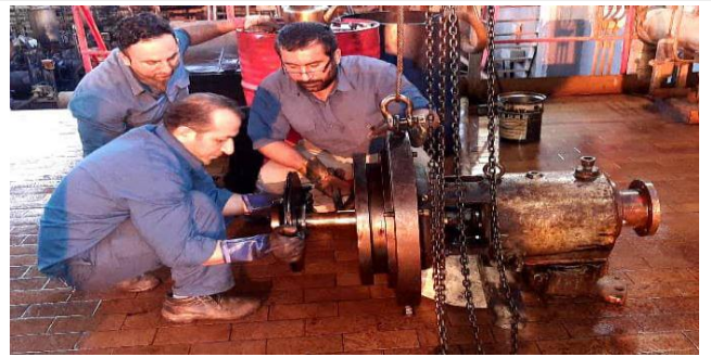
باز کردن پمپ مرحله دوم مازوت خانه ۳۰۴ جهت تعمیر و سرویس و مونتاژ آن