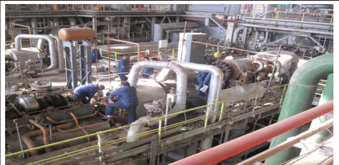
تعمیرات اساسی واحد ۶ نیروگاه رامین اهواز