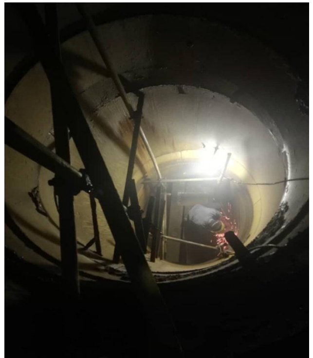
جوشکاری ورودی کندانسور شاخه B واحد ۳