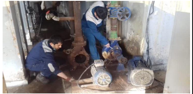
باز کردن پمپهای تغذیه کمپرسورهای واحد ۵ و ۶ جهت تعمیر اساسی