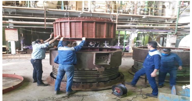
بازسازی و تعمیر الکتروموتور برجهای خنک کن