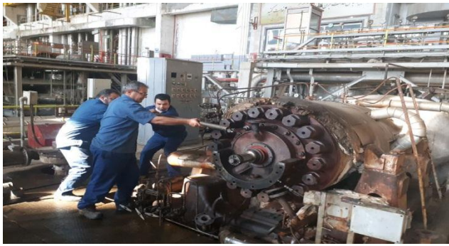
اورهال پمپ توربو فید پمپ واحد ۶