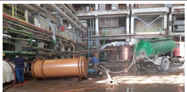
قلبشویی کولر MHC واحد ۱ با رعایت مسائل زیست محیطی