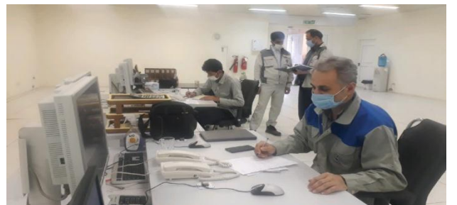
تداوم تولید پایدار انرژی برق نیروگاه افق ماهشهر؛ بدست توانمند متخصصان نیروگاه رامین