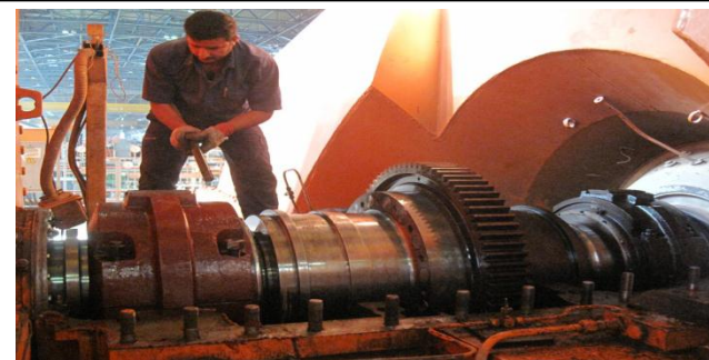
تعمیرات اساسی واحد ۶ نیروگاه رامین اهواز