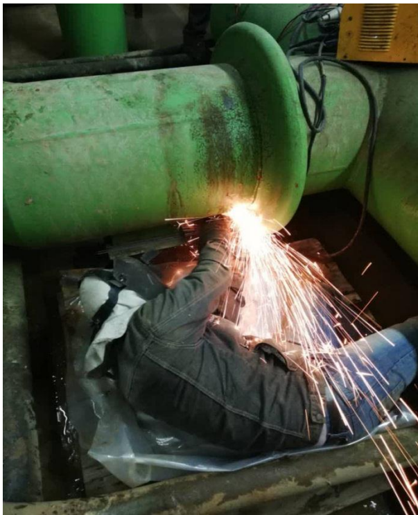
جوشکاری و رفع عیب نازل و دهانه مشعلهای واحد ۳