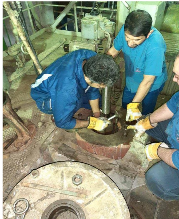
مونتاژ نهایی گیت والو گ. پ. ز. واحد ۵