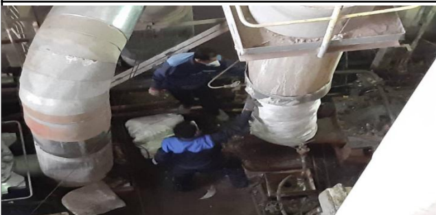
عایق کاری و ورق کاری مسیرهای ورود و خروج بوستره پمپ ها واحد ۳