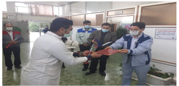
تقدیر مدیرعامل از کادر درمان و پرستاران نیروگاه رامین اهواز در روز میلاد با سعادت حضرت زینب(س)