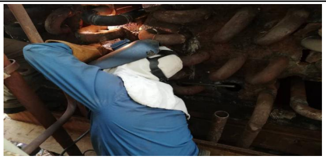
تعویض شبانه روزی لوله های معیوب اکونومایزر شماره یک استارت بویلر ۱_۴