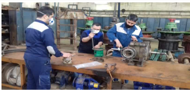
مونتاژ پمپ رزرو Hoc توسط تلاشگران اداره پمپها