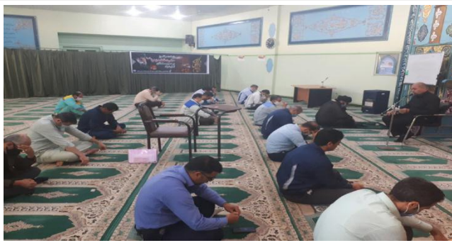
سوگواری به مناسبت شهادت حضرت فاطمه (س) در محل نمازخانه نیروگاه