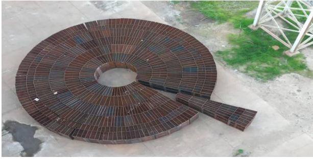
چیدمان بسکت های لابه گرم واحد ۶ جهت تعویض در تعمیرات اساسی