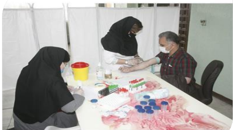
لینک بازتاب خبر در رسانه های کشور :