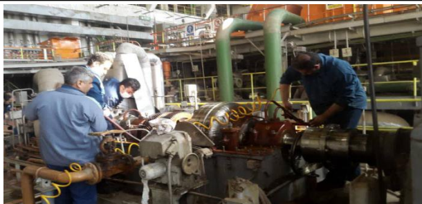
دمونتاژ هیدروکوپلینگ فید پمپ B واحد ۶