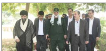
تولید پایدار برق و همچنین تحقق مسئولیتهای اجتماعی و فرهنگی از مهمترین اهداف این بازدید چند

ساعته بود. فرماندهی ارشد سپاه جنوب در آغاز ورود به نیروگاه با حضور در یادمان شش شهید نیروگاه رامین با قرائت صلوات و فاتحه به ساحت شهدای این صنعت ادای احترام کرد.