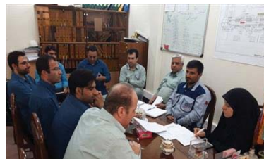
نخست مدیر کل حراست و مسؤل امور ایثارگران صنعت برق حرارتی کشور با جمعی از ایثارگران معزز نیروگاه رامین

برگزاری جلسه کارگروه رونق تولید مهندسی مکانیک نیروگاه رامین