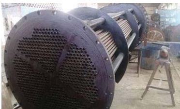
بازسازی ستهای ثابت گیت والو ۱۱۳ واحد ۳ نیروگاه رامین

اتمام عملیات ساخت کامل کوپل کولر بخار استارت بویلر فاز ۳ نیروگاه رامین اهواز